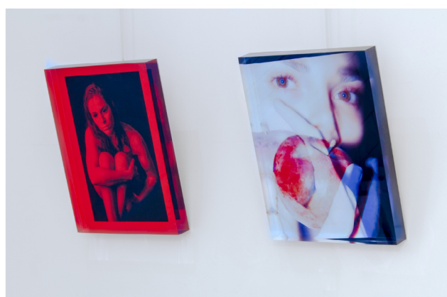
LILITH & EVE