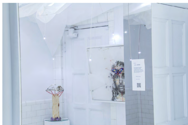
ACTE 2 : OUVRE