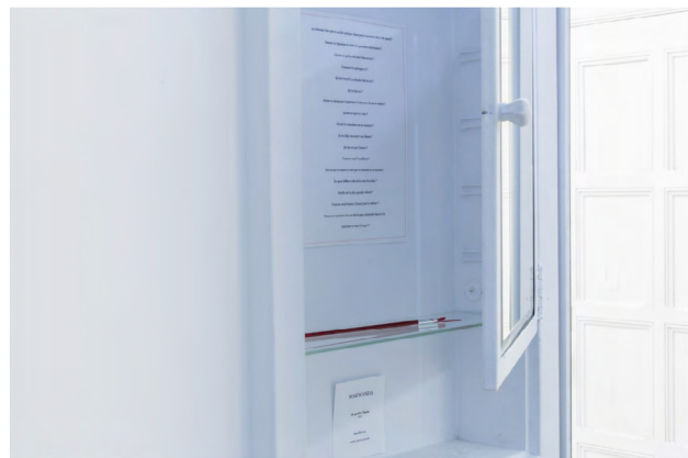
JE GOÛTE NOUS