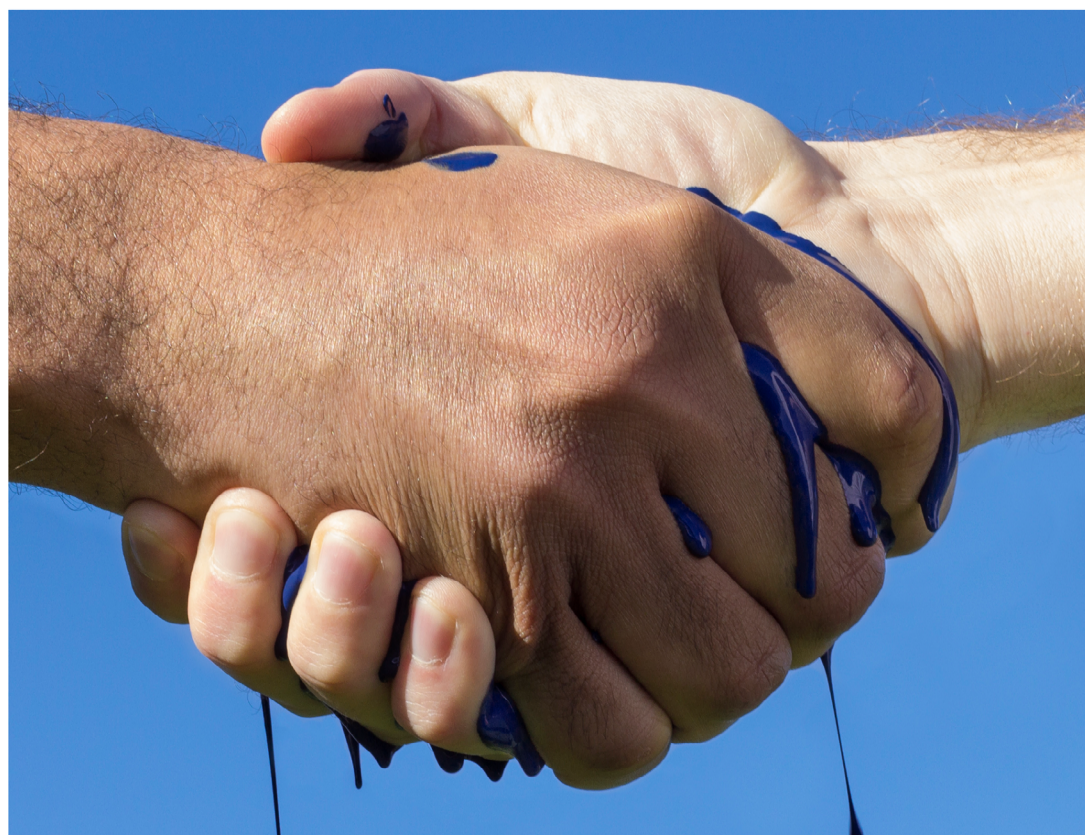
La promesse du créateur 2019 Photographie